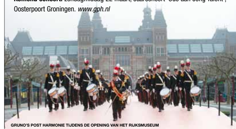
GRUNO'S POST HARMONIE TIJDENS DE OPENING VAN HET RIJKSMUSEUM

Komend concert: zondagmiddag 22 maart, Jaarconcert 'Ode aan Jong Talent', Oosterpoort Groningen. www.gph.nl