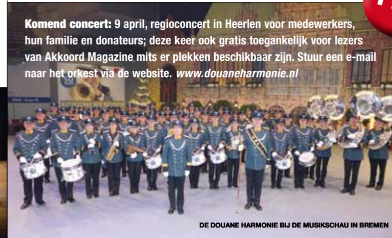
DE DOUANE HARMONIE BIJ DE MUSIKSCHAU IN BREMEN

Komend concert: 9 april, regioconcert in Heerlen voor medewerkers, hun familie en donateurs; deze keer ook gratis toegankelijk voor lezers van Akkoord Magazine mits er plekken beschikbaar zijn. Stuur een e-mail naar het orkest via de website. www.douaneharmonie.nl