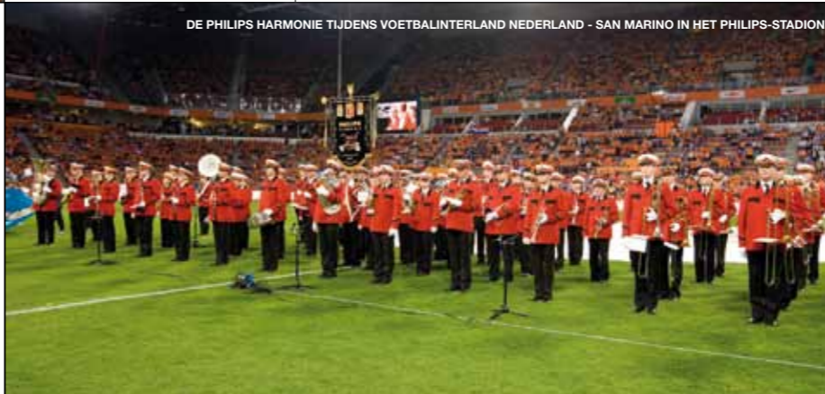
DE PHILIPS HARMONIE TIJDENS VOETBALINTERLAND NEDERLAND - SAN MARINO IN HET PHILIPS-STADION