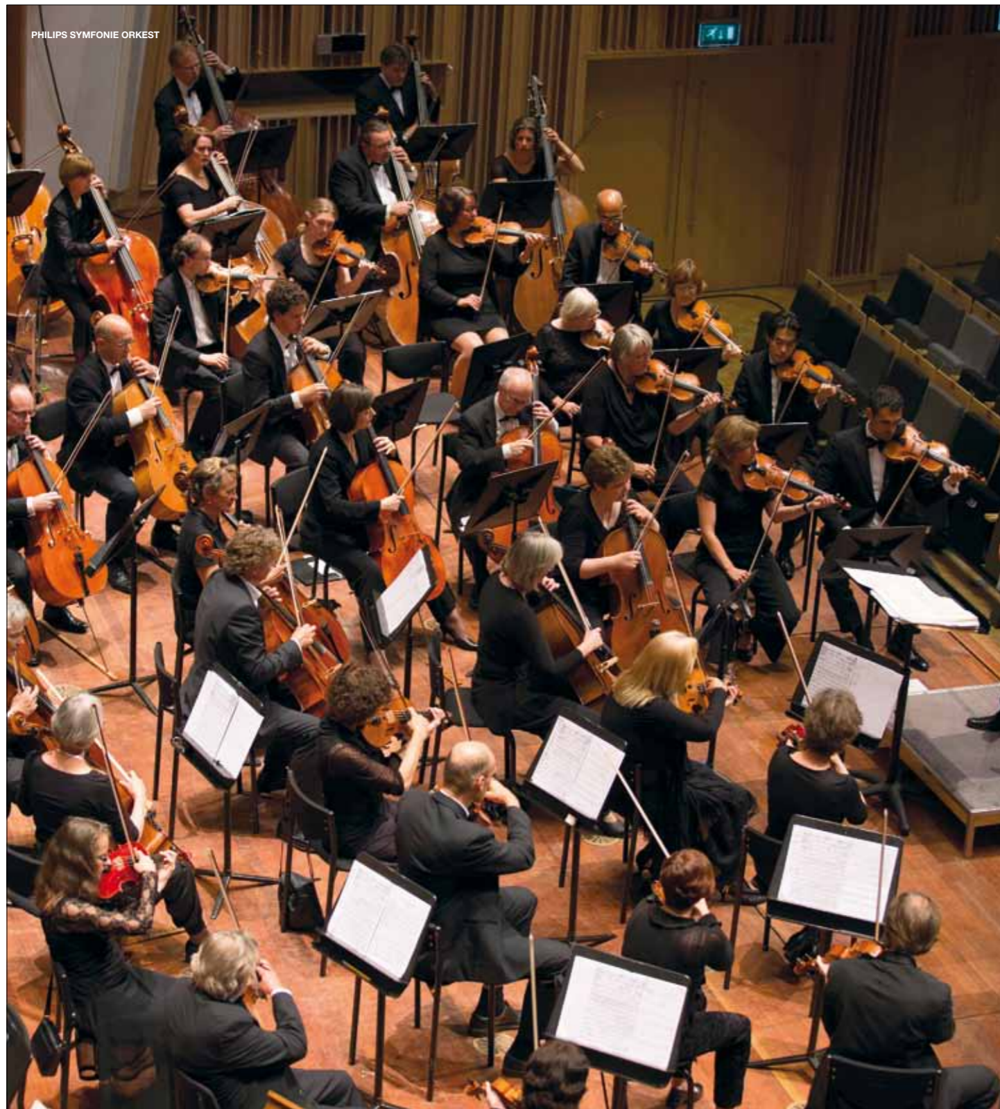
PHILIPS SYMFONIE ORKEST