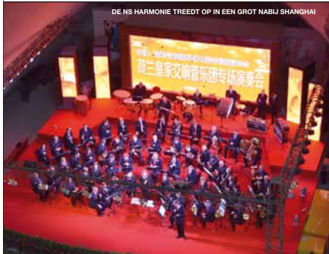
DE NS HARMONIE TREEDT OP IN EEN GROT NABIJ SHANGHAI

Komende concerten: 'Als deze oorlog ooit nog eindigt' met Toonkunstkoor Utrecht, 1 t/m 3 mei, Spoorwegmuseum, 20.00 uur. www.nsharmonie.nl