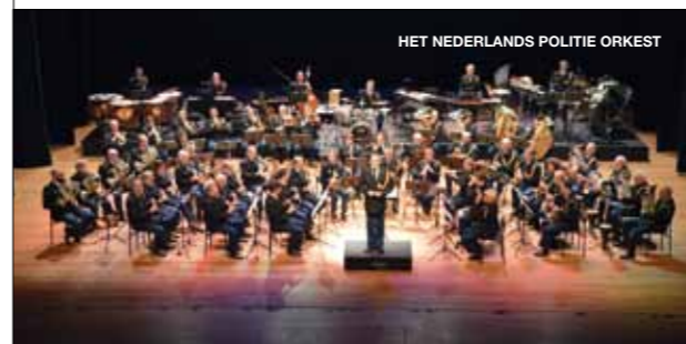
HET NEDERLANDS POLITIE ORKEST

Komend concert: dinsdag 5 mei, 15.00 uur, bevrijdingsconcert in Zuidbroek. www.politieorkest.nl