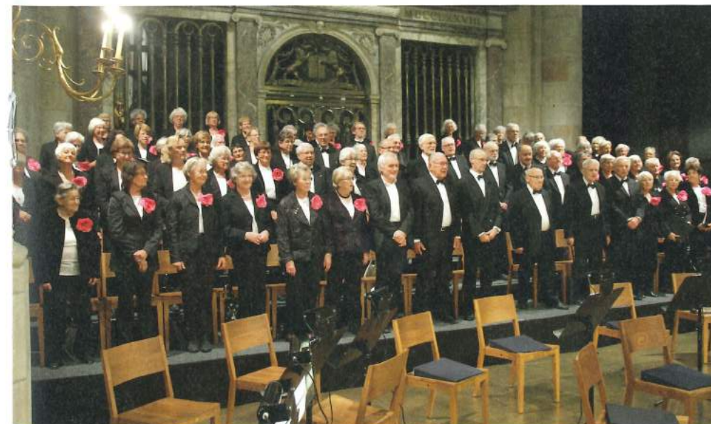
Toonkunst Plus Gouda

Wat beide dirigenten nog wel benadrukken, is het sociale aspect van een seniorenkoor. Rijkaart: "Hier speelt sneller dat zangers of hun partners ziek worden of overlijden. Er is extra aandacht voor elkaar om elkaar te steunen in dat soort situaties." De wereld wordt snel kleiner als je ouder wordt, en door de repetities komen de koorleden nog buiten en ontmoeten ze nieuwe mensen die in een vergelijkbare situatie zitten. Rijkaart: "Voor veel zangers is koor het hoogtepunt van de week: gezelligheid, mooie muziek en geprikkeld worden om te presteren."